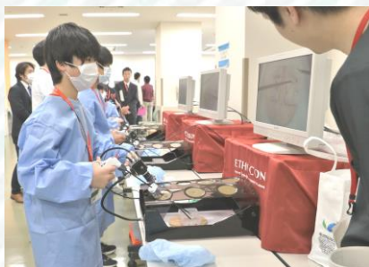
ゲーム感覚で楽しめる内視鏡操作にみんな夢中♪