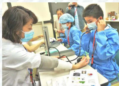
聴診器を使って血圧を測る姿は真剣そのもの。