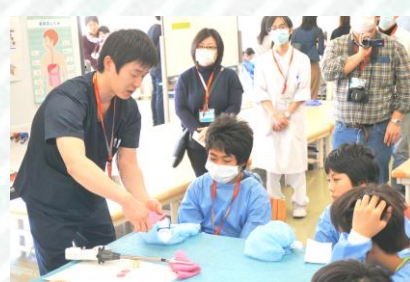
医師の説明をみんな真剣に聞いています。