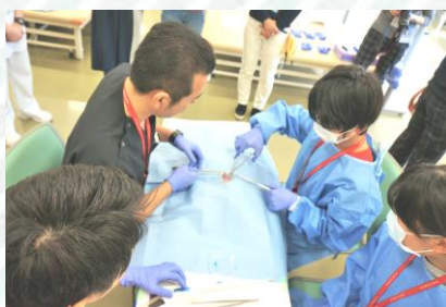
電気メスで医師と一緒に豚肉をカット! ドキドキです。