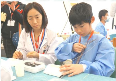
専用針を使用した縫合体験 みんなとっても器用です!