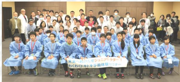
未来のジュニアドクター★全員集合

小学5・6年生29人(男子21人、女子8人)が実際に医療器具に触れたり、医師等40人以上の病院職員と話をしたり、楽しく模擬手術を体験しました。