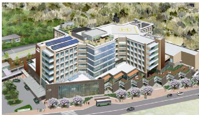
(完成予想図：改築後の井田病院)

前回の「解体工事」、「地下掘削工事・山留（やまどめ）工事」に続きまして、改築工事の現状を報告させていただきます。