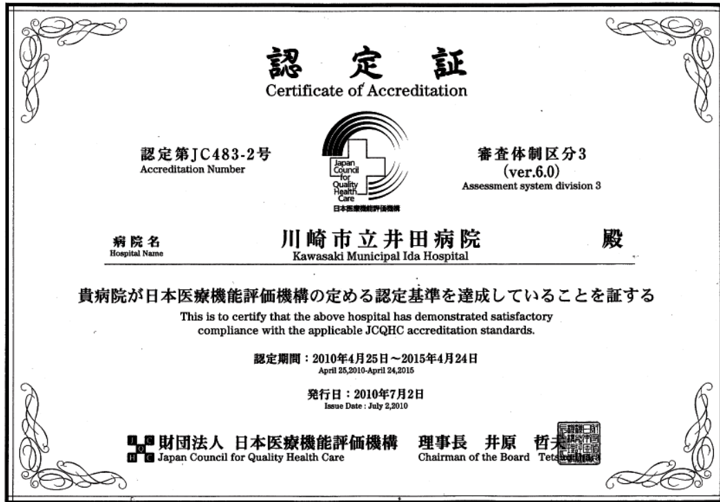
「財団法人 日本医療機能評価機構」による認定