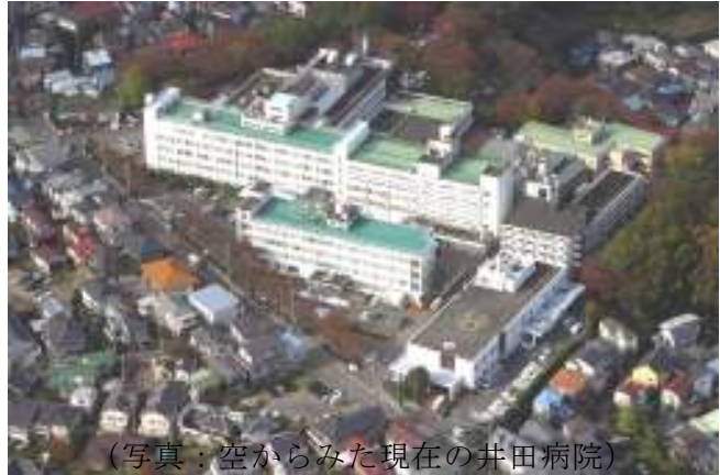
(写真：空からみた現在の井田病院)